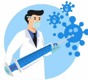
ВАКЦИНЫ БЕЗОПАСНЫ И ЭФФЕКТИВНЫ