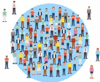
ПОЗВОЛЯЕТ ЗАЩИТИТЬ НЕ ТОЛЬКО ЧЕЛОВЕКА, КОТОРОМУ СДЕЛАЛИ ПРИВИВКУ, НО И ОКРУЖАЮЩИХ