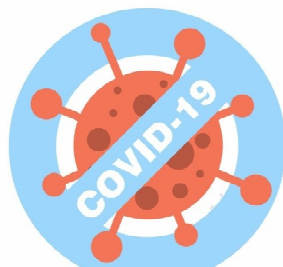
ПОМОГАЕТ ОГРАНИЧИТЬ РАСПРОСТРАНЕНИЕ ИНФЕКЦИИ