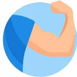
ПРЕДУПРЕЖДАЕТ БОЛЕЗНЬ И ЕЕ ОСЛОЖНЕНИЯ