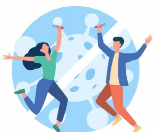
ПРОЧНАЯ ОСНОВА ДЛЯ ЗДОРОВЬЯ И БЛАГОПОЛУЧИЯ НА ДЛИТЕЛЬНОЕ ВРЕМЯ