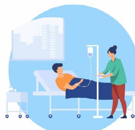
ЕСЛИ НЕ СДЕЛАТЬ ВАКЦИНАЦИЮ, МОГУТ ВОЗНИКНУТЬ ТЯЖЕЛЫЕ ПОСЛЕДСТВИЯ, ВПЛОТЬ ДО ГИБЕЛИ